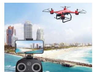
スマホで空撮画像を楽しめる 高解像度カメラ付きドローン