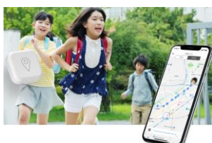
子供の見守りシステム GPS Bot

近年、GPS受信機の小型化や低価格化、背景地図を表示するコンピュータシステムの低価格化が進み、カーナビやスマートフォン、ドローンなどへの搭載が広がり、さまざまな分野でGPSを利用したサービスが提供されています。