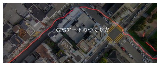
自分の足あとが作品になる！ GPSアート