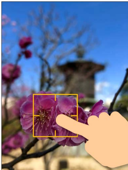
▲手前の梅をタッチして手前にピントが合った状態

スマホの画面でピントを合わせたいものを少し長めにタッチしてみましょう。その部分にくっきりとピントが合い、露出（光の量）が自動的に調整されます。